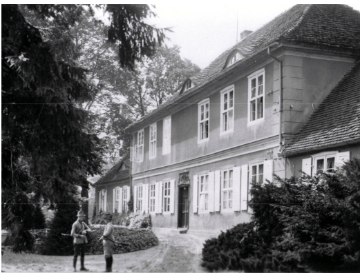
Gutshaus Wutike in der Ostprignitz wahrscheinlich um 1930

Der zweite Besuch unserer diesjährigen Tour galt dem alten Gut der Familie von Platen, Wutike, in der Ostprignitz, dem letzten der ehemals 6 Hauptbesitzungen dieser Familie in der Prignitz.